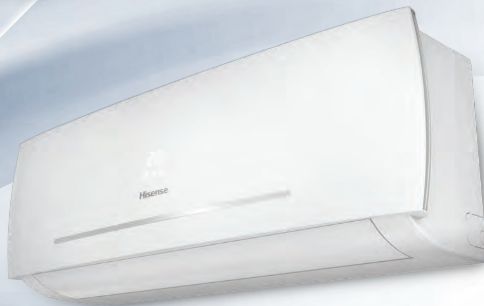
NEO Classic A